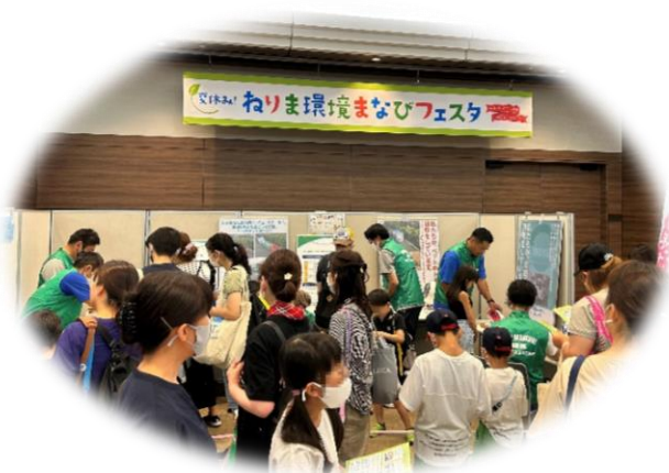
▲ ねりま環境まなびフェスタ