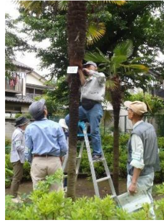
2022年 春 みどりの区民会議で活動する40代男性