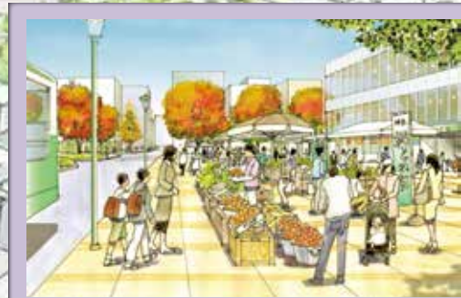
3 地場農産物のマルシェ