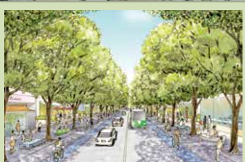
1 みどり豊かな幹線道路