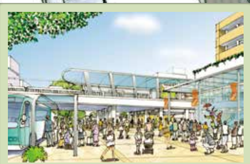
1 多くの人々にぎわう駅前空間