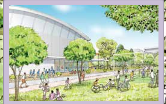
3 自然の中でスポーツを楽しむまち