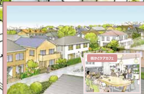
4 良好な環境を備え住民が支えあう住宅地