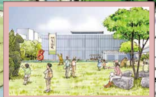
4 文化芸術の香り高いまち