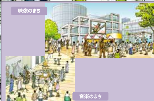
3 地域の特色を活かし個性を発揮するまち