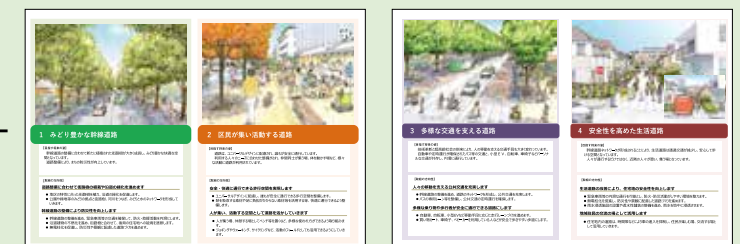
具体的なまちのイメージを示した絵と説明