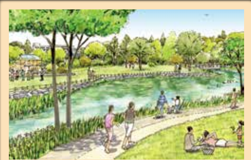
2 楽しみと安全をもたらす大規模公園