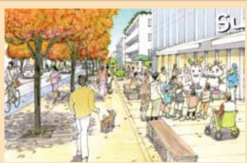
2 区民が集い活動する道路