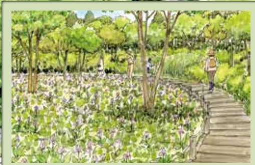
1 自然とふれあう憩いの森