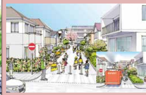
4 安全性を高めた生活道路