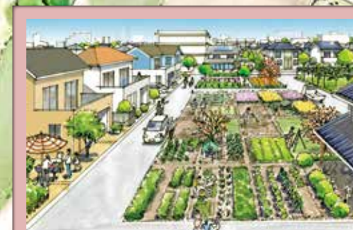
4 農と共存する住宅地