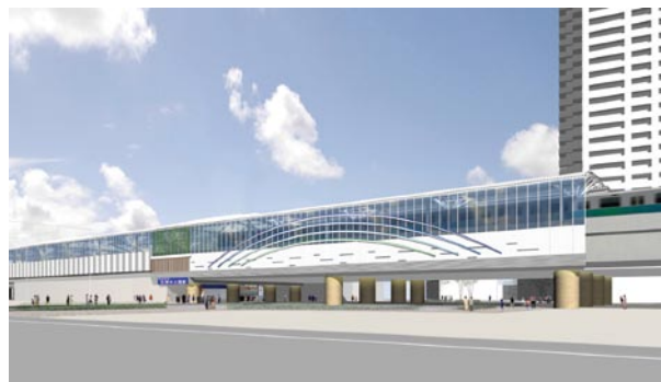
石神井公園駅駅舎改築後の完成イメージ