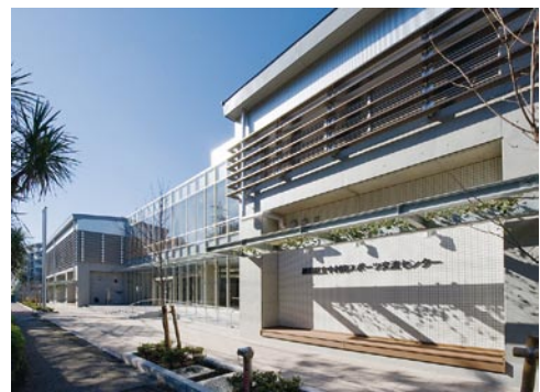
中村南スポーツ交流センター（平成21年1月開館）