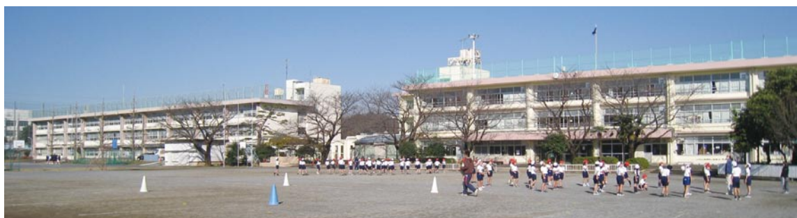
練馬区初の小中一貫教育校となる大泉学園桜中学校（左）と大泉学園桜小学校（右）