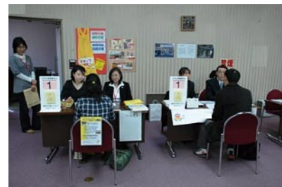
練馬介護人材育成・研修センターによる就職面接会