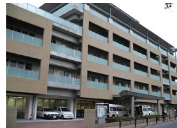
大泉特別養護老人ホーム