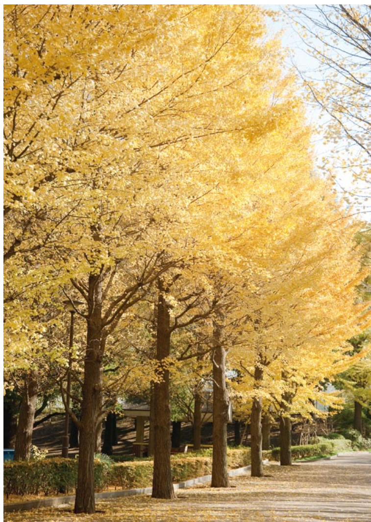
城北中央公園のイチョウ並木