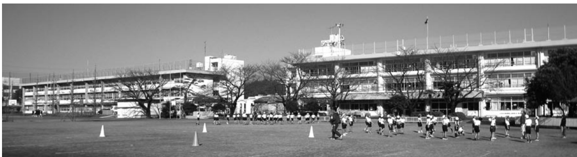
練馬区初の小中一貫教育校となる大泉学園桜中学校（左）と大泉学園桜小学校（右）