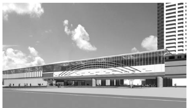
石神井公園駅駅舎改築後の完成イメージ