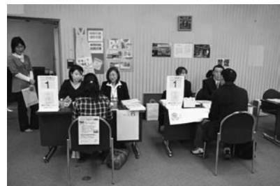
研修センターによる就職面接会