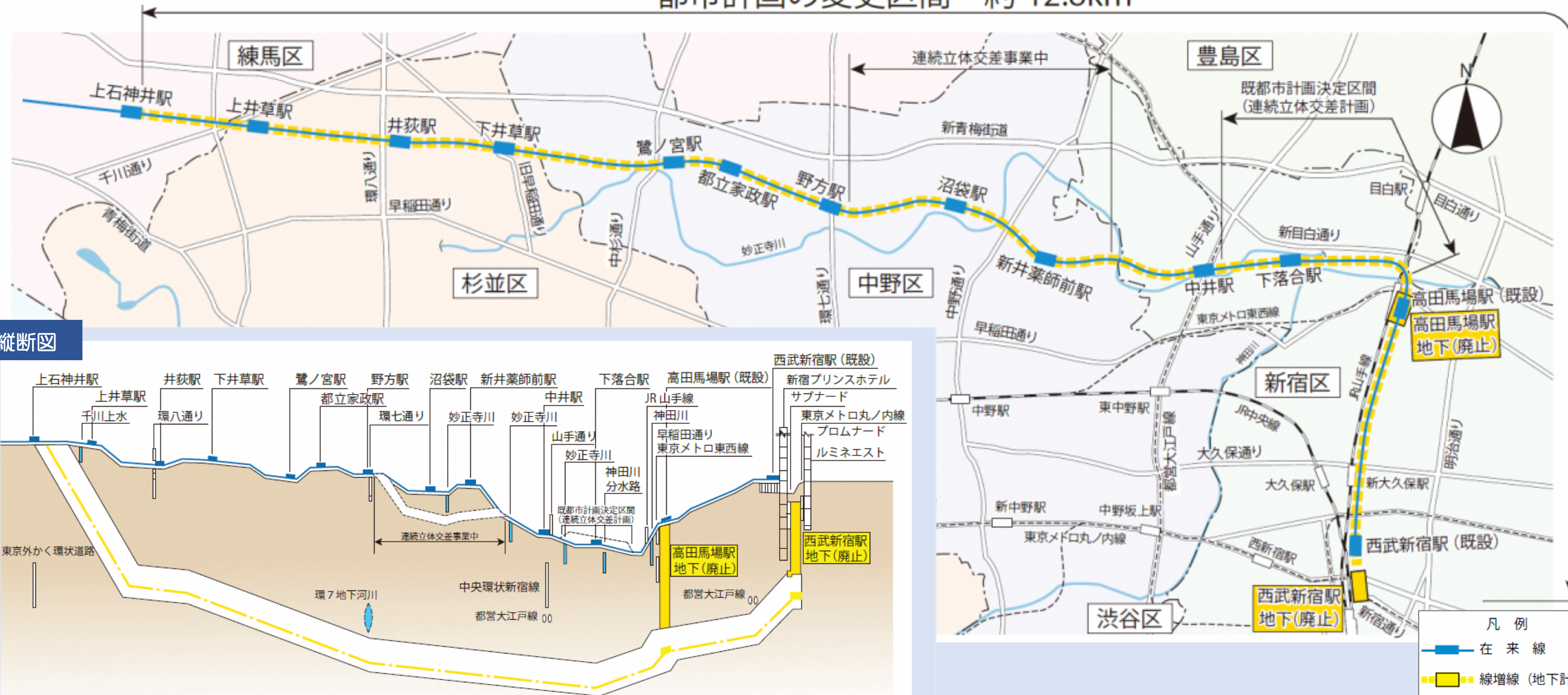
都市計画の変更区間 約 12.8km