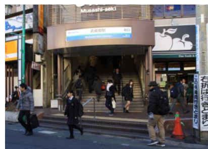
駅前の様子 (武蔵関駅北口)