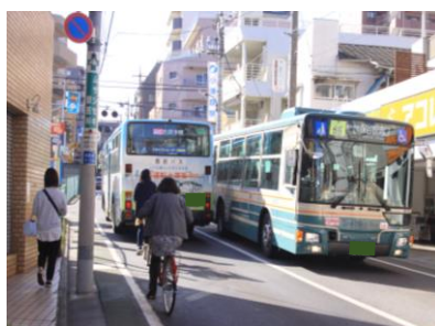
バス通りの様子 (関町庚申通り)