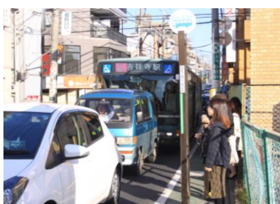
駅周辺バス停の様子 (「武蔵関駅入口」バス停)

武蔵関駅周辺では、バス停が 4 か所に分散し、駅からも離れているなど、鉄道・バス・タクシーの乗換え利便性や安全性が課題となっています。練馬区では、西武新宿線の連続立体交差化と合わせて駅前広場を整備することにより、安全で快適なまちづくりの実現を目指していきます。