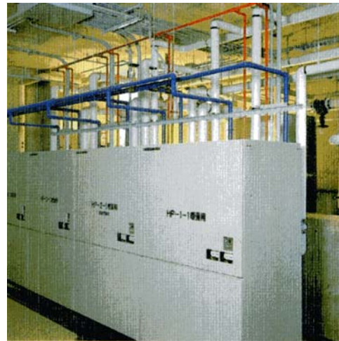
サブステーション内施設