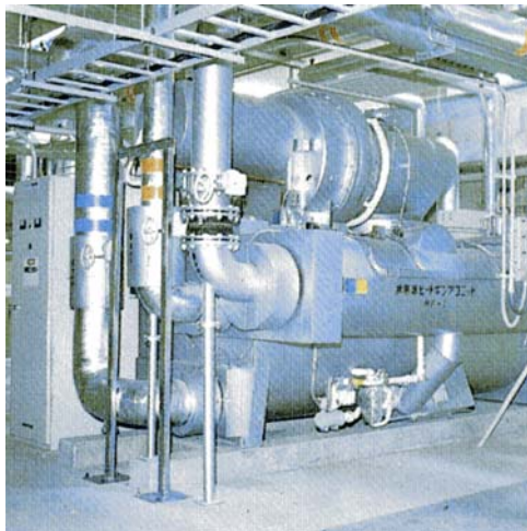
センタープラント内施設