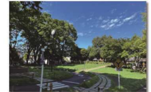
みどり豊かな大泉交通公園