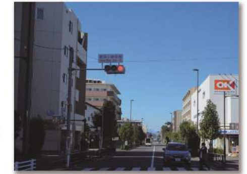
補助156号線沿道地区のイメージ