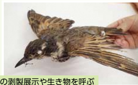
鳥の剥製展示や生き物と呼ぶ 環境づくりに活用します