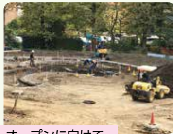
オープンに向けて 工事が進んでいます