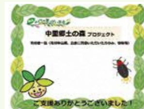
森の学習棟で寄付者様のお名前を掲示予定