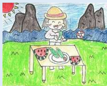
上家 まいさん 作画（旭丘小学校3年時）