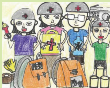
あきた りり 作画 (中村中学校1年時)