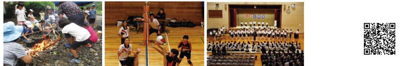
青少年課青少年係、各青少年育成地区委員会事務局