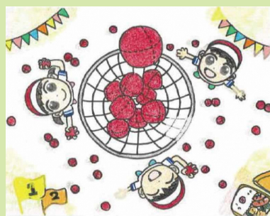
おちあい ひな 作画 (田柄小学校6年時)