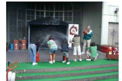
青少年課青少年係

新型コロナウイルス感染症予防対策ガイドラインに基づいて、ジュニアリーダー養成講習会、子ども会事業などの行事を企画・運営しています。また、青年リーダーの地域活動を推進しています。 *ジュニアリーダー養成講習会 小学5・6年生、中学生を対象に体験学習、レクリエーションなどを通じて、地域活動で中心的役割を担う青少年を育成しています。学校や学年を超えた友達づくりや交流の機会がもてます。