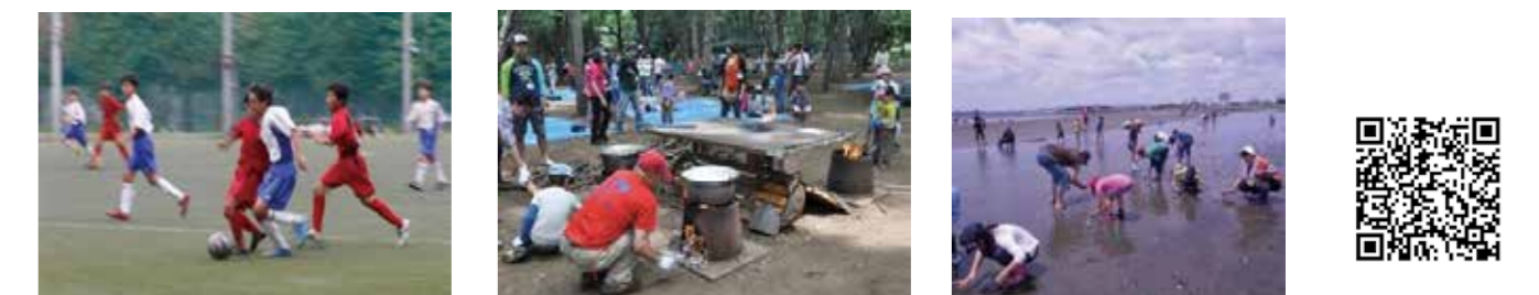
青少年課青少年係、各青少年育成地区委員会事務局