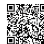
青少年課青少年係

学校・地域では 地域の方々が、子どもや地域のために知識やパワーを活かすとともに、学校施設を有効活用し、学校応援団...区立小学校65校 地域の核としての開かれた小学校づくりを推進しています。