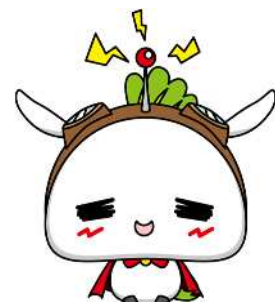
練馬区公式アニメキャラクターねり丸 ©練馬区

アンケートにご協力いただき、ありがとうございました。 返送用封筒に入れてご返送ください。切手を貼る必要はありません。