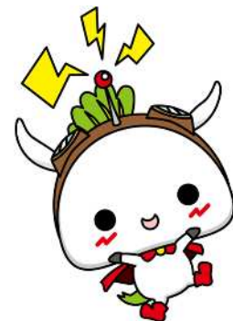
練馬区公式アニメキャラクターねり丸 ©練馬区