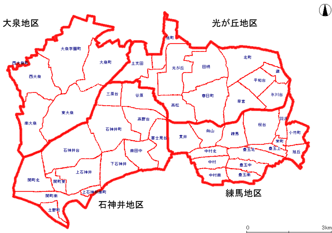
<総合福祉事務所管轄単位の区域設定イメージ図>

総合福祉事務所管轄単位の区域設定のイメージ図および事業ごとの教育・保育提供区域については以下のとおりです。