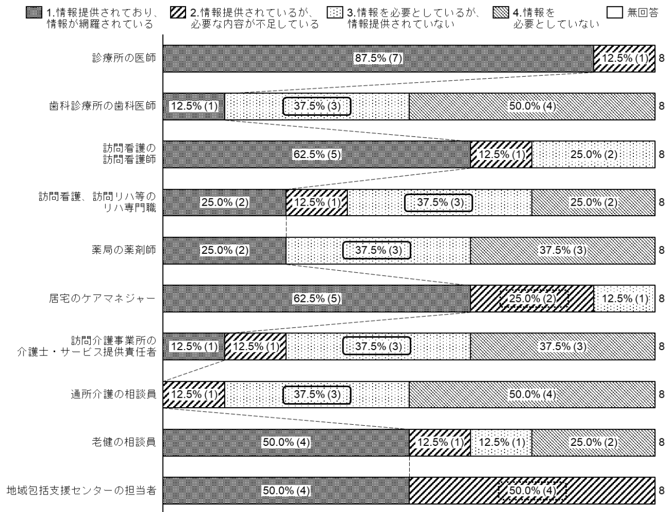
P.49 図表 62 入院時の多職種からの情報提供充足度（地域連携室）