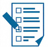
在宅医調整依頼票