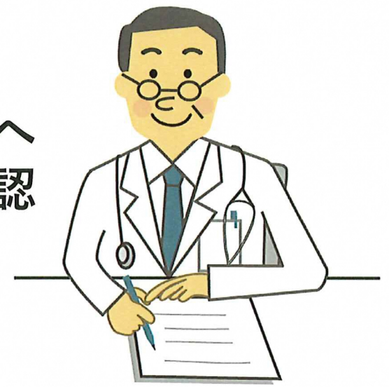
紹介元（かかりつけ医）