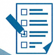
在宅医調整依頼票