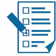
在宅医調整依頼票