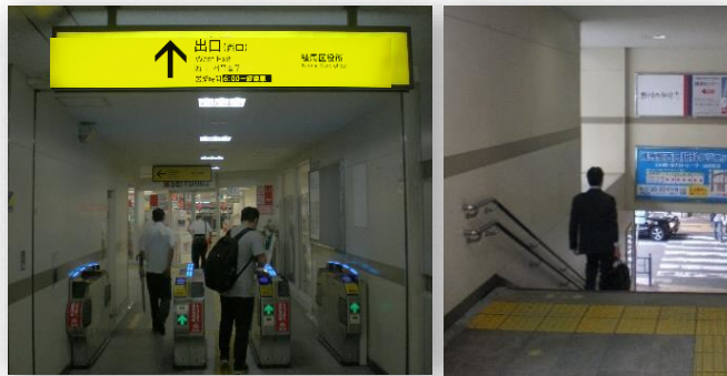
エレベーターがある改札口が別にあることが、案内標示でわからない。