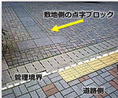
敷地側の点字ブロック 管理境界 道路側