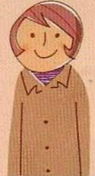
主任ケアマネジャー

高齢者相談センターでは、保健師、社会福祉士、主任ケアマネジャーなどが中心となって高齢のみなさん練馬区は、練馬・光が丘・石神井に設置しています。また、各高齢所設置しています。(4・5ページ、裏表紙参照)