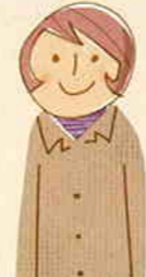
主任ケアマネジャー

地域包括支援センターでは、保健ジャーなどが中心となって高齢の練馬区は、練馬・光が丘・石神井に設置しています。また、各地域が所設置しています。(4・5ペー