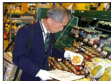
店頭での監視の様子