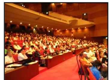
食品衛生実務講習会の様子

すし店、食肉販売店といった業態ごとの営業者・食品衛生責任者 ※8 を対象に、それぞれの業態の特性を踏まえた衛生管理についての講習会を実施します。