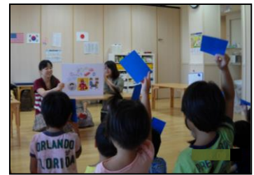
手洗い教室の様子

近年多発しているノロウイルスによる食中毒をはじめ、食中毒予防には手洗いが有効です。正しい手洗いを子供のうちから身につけてもらうため、保育園児・小学1年生を主な対象とした「食の安全教室(手洗い教室)」を実施します。また、食育推進事業を通じて、食品衛生知識の普及啓発を図ります。