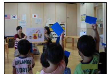
手洗い教室の様子

近年多発しているノロウイルスによる食中毒をはじめ、食中毒予防には手洗いが有効です。正しい手洗いを子供のうちから身につけてもらうため、保育園児・小学1年生を主な対象とした「食の安全教室（手洗い教室）」を実施します。