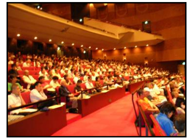
食品衛生実務講習会の様子

すし店、食肉販売店といった業態ごとの営業者・食品衛生責任者 ※6 を対象に、それぞれの業態の特性を踏まえた衛生管理についての講習会を実施します。