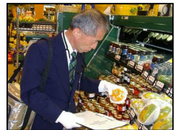
店頭での監視の様子

平成 27 年 4 月から施行された食品表示法に基づき、関係機関と連携協力して食品等事業者が適正な表示を行うよう監視指導を行います。