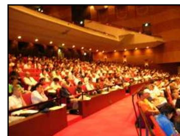
食品衛生実務講習会

食品衛生責任者を主な対象とし、自主的な衛生管理の推進に関する事項や最新の食品衛生に関する知識を提供するため、食品衛生実務講習会を実施します。