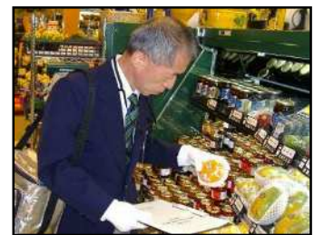
店頭での監視の様子

また、新たに成立した食品表示法は、食品衛生法をはじめJAS法や健康増進法などの法令が移行する部分もあり、施行に向けて情報収集し、準備を進め、各関係機関と連携協力して適正表示の推進に努めます。