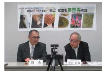
オンラインで開催した 「練馬区食の安全・安心講演会」

区民、食品等事業者、行政関係者が質疑応答等を通じ意見交換を行い、それぞれの立場に対する理解を深めることで、食の安全・安心に対する意識の向上を図ります。