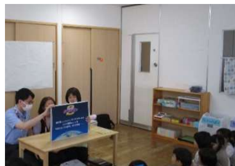
「食の安全教室（手洗い教室）」の様子

また、要望に応じて保育園児や小学 1 年生等を対象に「食の安全教室（手洗い教室）」を実施します。