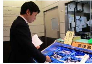
店頭での監視の様子