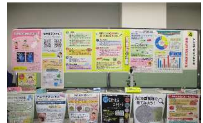
「消費生活展ねりま」 でのパネル展示

区民の食品衛生意識の向上のため、要望に応じて食品衛生出前講習会を実施し、食品衛生に係る情報を提供します。また、庁内他部署の実施するイベントに出展し、来場する消費者に対して積極的に食品衛生知識の普及啓発を行い、食品による健康被害発生の防止に努めます。