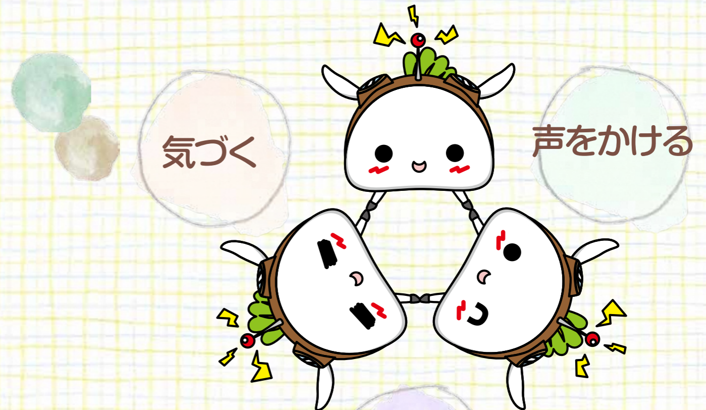
練馬区公式アニメキャラクターねり丸 © 練馬区