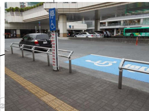
※改良工事により、車椅子使用者用停車スペースが設けられています。