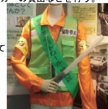
配付しているパトロール用品の一例