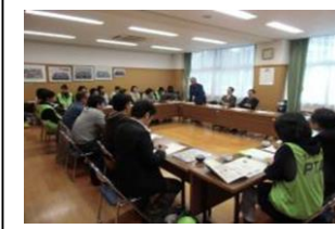
大泉第一小学校（あんしん大一）地域防犯防火連携組織連絡会