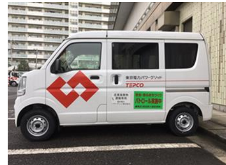
パトロールプレートを装着した協定団体の業務車両