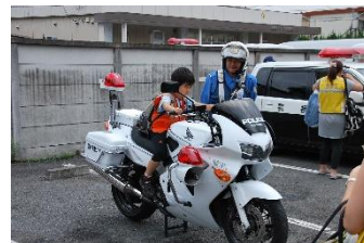
白バイに乗る子ども