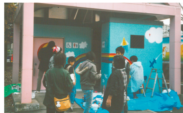
長光寺橋公園のトイレの壁面に絵を描きました

ト②参照)。いつも利用している石神井公園駅の周辺は、最近たばこの吸い殻やお菓子の箱などのポイ捨てが目立つようになり、まちの雰囲気が悪くなってしまわないか心配していました。そこで、月1回富士見台駅や石神井公園駅の駅前広場をみんなで清掃したり、ごみに気づいたら拾って持ち帰ったりするようにしています。区報を読んでいる方も道端のごみに気づいたらごみ箱へ入れるよう、ぜひお願いしたいです。