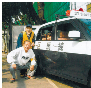
子どもたちと安全・安心パトロールカーでの巡回

区から安全・安心パトロールカーの貸し出しを受けて、南田中小付近のパトロールをしています。地域の中に溶け込んで、楽しくパトロールをするために、南田中小の児童と一緒に回っています。子どもの声で「地域の見守りをお願いします」と放送すると、知らない方もこちらを振り向いてくれますし、子どもたちの同級生や保護者は声を掛けてくれます。最初は恥ずかしがっていた子どもたちも、パトロールが終わる頃には「また乗りたい」と言います。地域の方と触れ合いな