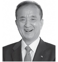
練馬区長 前川 あきお 耀男

コロナ禍により自宅にいる機会が増え、インターネット通販のトラブルや高収入をうたう副業勧誘などの相談が増加しており、今後も注意が必要です。引き続き、区民の皆様が安全で安心して暮らせるよう、取り組んでまいります。