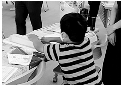
初めてのカンナかけ