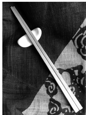
素敵なお箸ができました