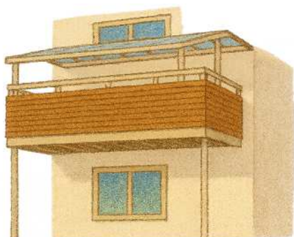
【ベランダや屋根の設置】