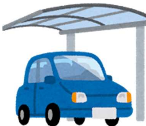
【カーポートの設置】