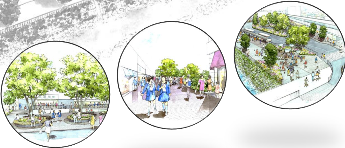
※パースは練馬区が検討しているイメージです 詳細は今後協議のうえ決定します