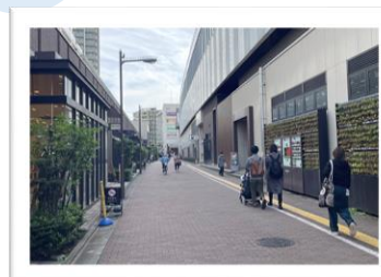
〔西武池袋線石神井公園駅付近〕