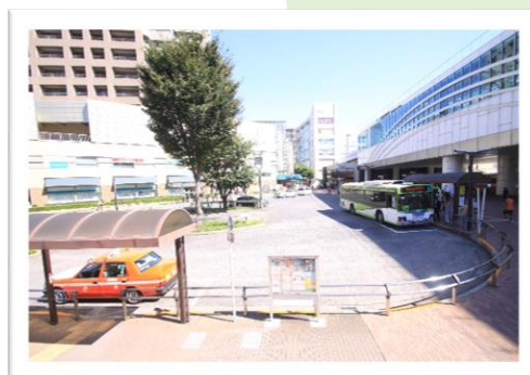
〔西武池袋線石神井公園駅北口交通広場〕