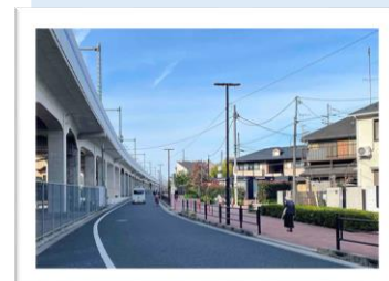
〔西武池袋線石神井町8丁目付近〕