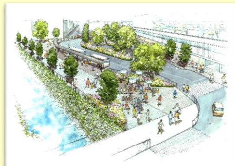
武蔵関駅駅前広場のイメージ