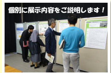
▲過去のオープンハウスの様子