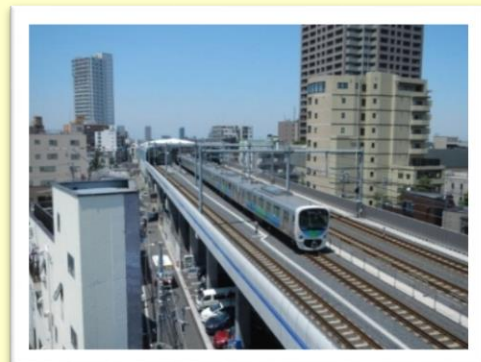
（参考写真）西武池袋線の立体化

〔西武鉄道新宿線（井荻駅～西武柳沢駅間）連続立体交差化計画について〕（H31年2月説明会配布資料）より引用