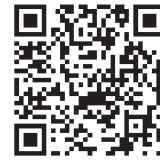
セーフティネット住宅