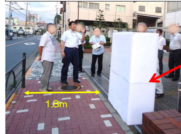
①公共施設に設置(はつらつセンター内)