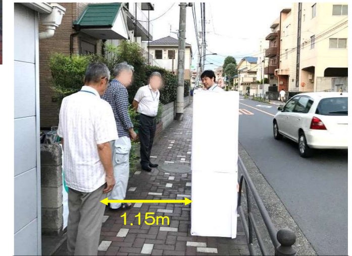
②歩道上に設置(はつらつセンター北側歩道)