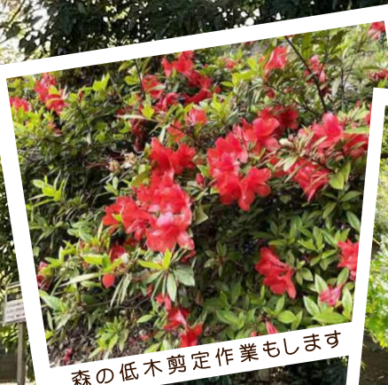
森の低木剪定作業もします

★毎回参加できなくても、途中参加でも大丈夫です。★活動日は変更する可能性があります。ご都合のよい時にご参加ください。