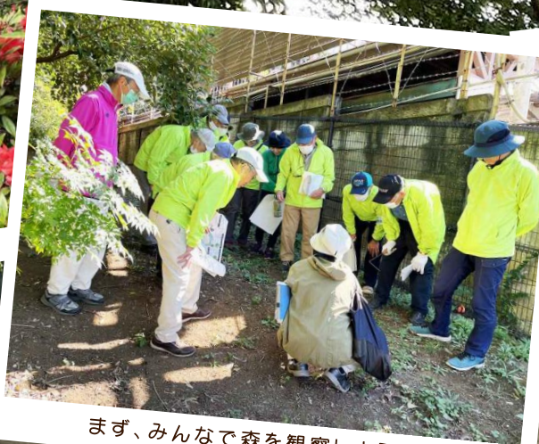
まず、みんなで森を観察しよう!