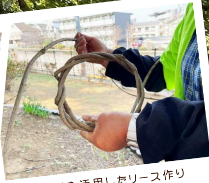
森の素材を活用したリース作り