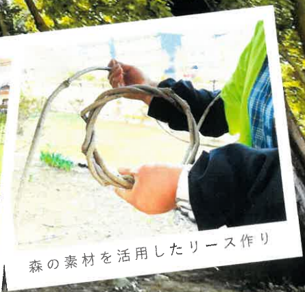
森の素材を活用したリース作り