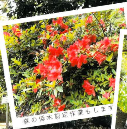
森の低木剪定作業もします

★毎回参加できなくても、途中参加でも大丈夫です。★活動日は変更する可能性があります。ご都合のよい時にご参加ください。