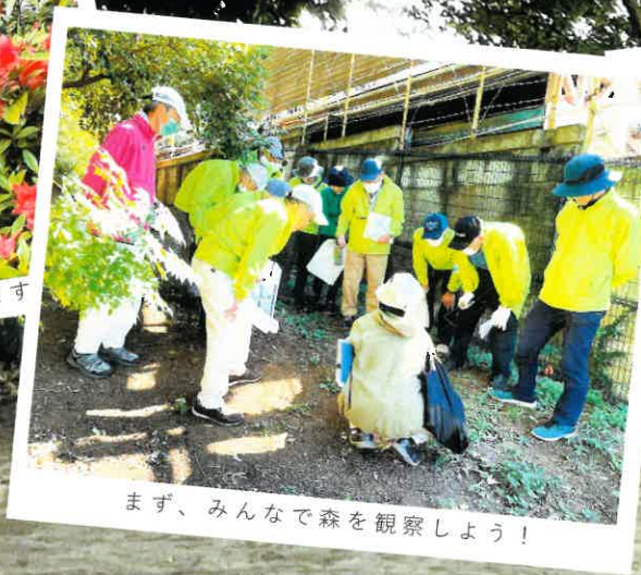
まず、みんなで森を観察しよう！