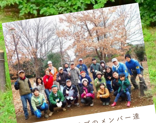
ファンクラブのメンバー達

★毎回参加できなくても、途中参加でも大丈夫です。ご都合のよい時にご参加ください。