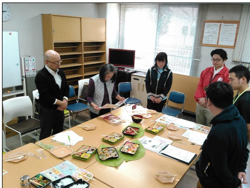
関町特別養護老人ホームでの定例会

おたがいさまを合言葉にして、医療や介護、地域団体のメンバーが集まって、さまざまな講座やイベントを行っています！