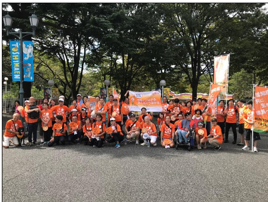
認知症当事者と支援者をつなぐRUN伴