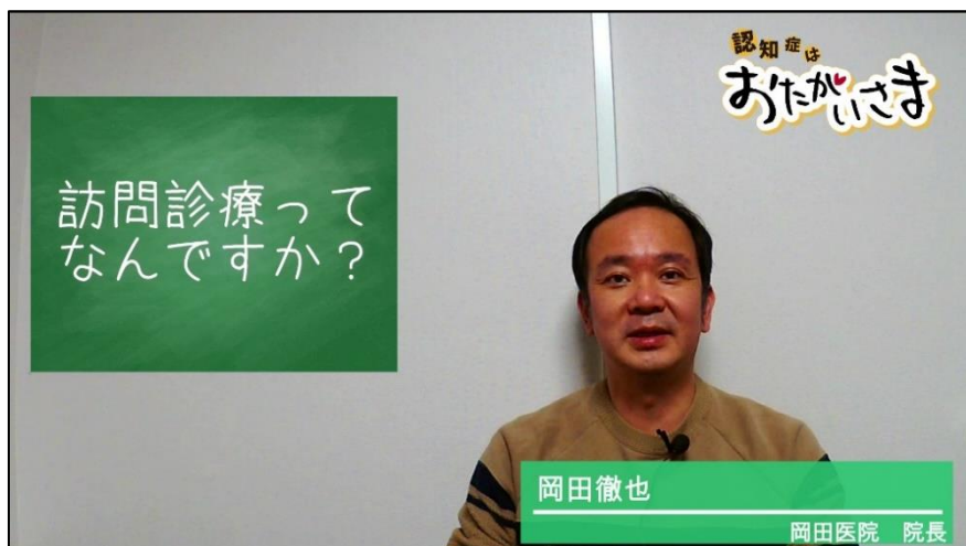
認知症を支える人たちを紹介する 『おたがいさま動画』