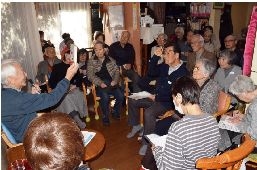
最首悟先生のにこやかな講演会