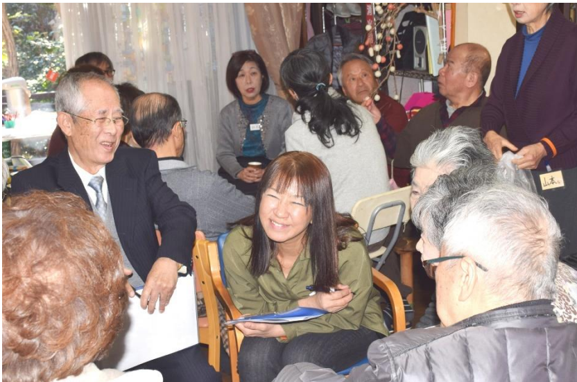
講演会の後 グループの話し合い