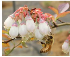
農作物の受粉促進