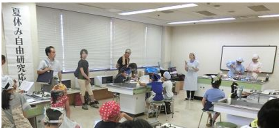
夏休み 自由研究 応援教室