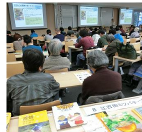
ミツバチと ハチミツを 活かす講演会