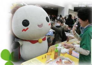
「練馬つながる フェスタ」出展