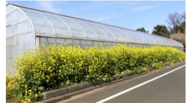
花壇は地域で評判