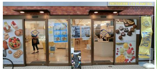
パティスリー プラネッツ