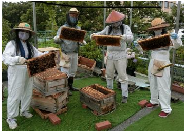
ミツバチの内検作業