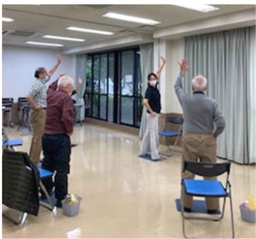
男性も参加のフレイル予防体操