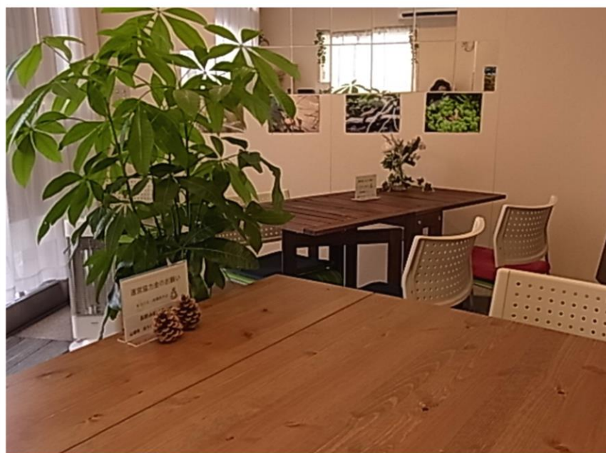
土曜開催の街かどケアカフェの様子