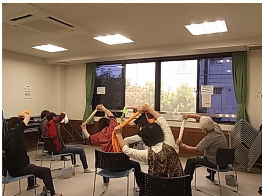
タオルを使うフレイル予防体操

場所は西税務署近くの商店街の店舗です。フレイル予防体操は地域集会所を利用しています。毎月新しいカレンダーを作り配布していますので楽しみにして下さい。