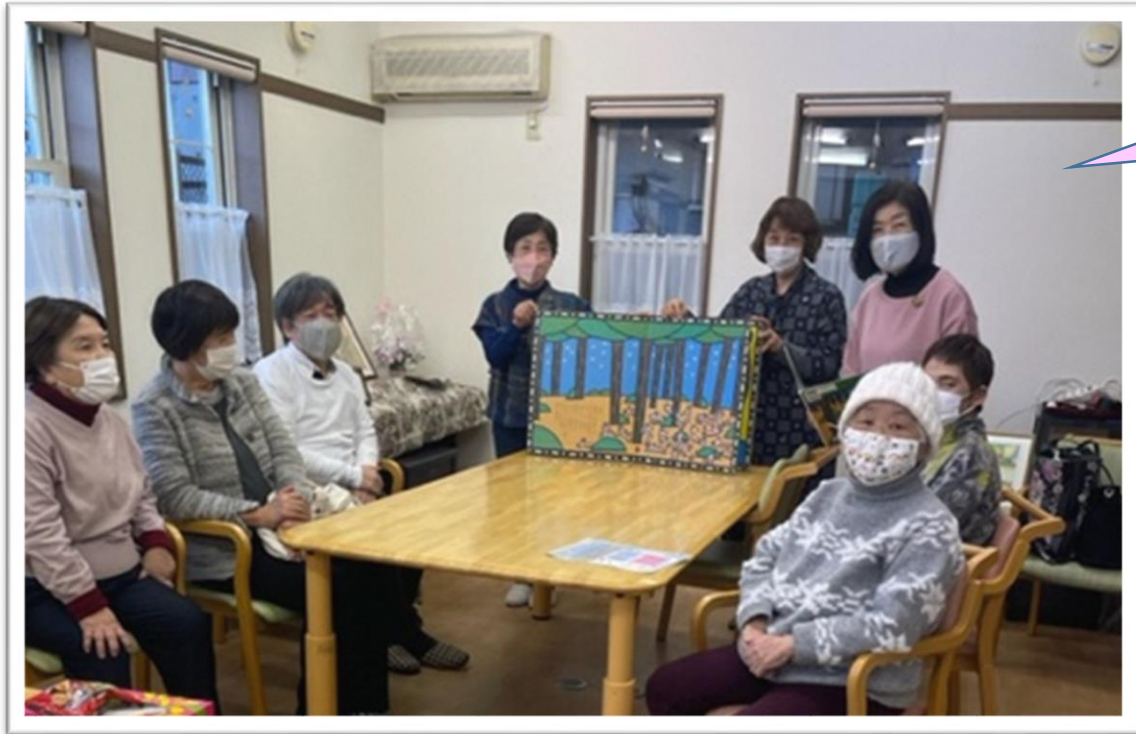
カフェ開催時のようす

2021年1月からカフェを開催し、介護保険制度の利用の仕方から始め、趣味活動、脳トレ等を行なってきました。 コロナの感染拡大の中で制約もありましたが、可能な限り開催してきました。 今後クリスマス会、新年ミニコンサート等企画して地域に発信していきます。