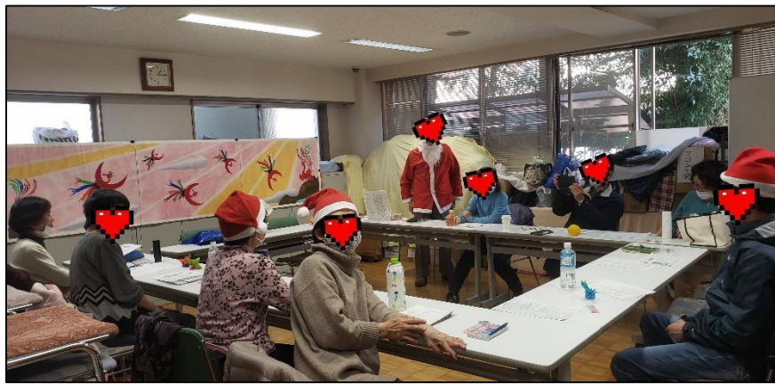
いつかのちやのまの様子