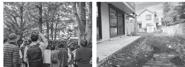
樹木医を呼んで団地のみどりをツアー 空き地を地域の憩いの場に (花と緑の会有志) (南大泉手作りガーデン)