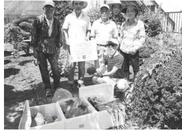
男性会員に人気という農園活動。30名ほどで野菜を作っています

「会員だけでなく、より多くの人たちに楽しんでもらえるよう社会奉仕活動にも力を入れていきたい