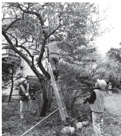
ウメの特性や剪定のポイントなどについて講義を受け、いざ実技演習!

“憩いの森”とは練馬区内に残る樹林地などを所有者から借り、区民に開放している場所。現在、区内には45か所の憩いの森があり、そのうちの1つ「南高松憩いの森」(高松2-14)を守り育てる活動をしているのが「南高松憩いの森ファンクラブ」です。ここは、184本の樹木が茂り、17種のコケが生息しているという、区内で