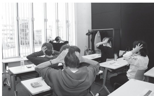
セルフボディケア講座では、むくみを取るリンパマッサージを行い、健康維持のヒントを学びました