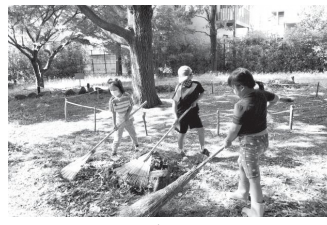
会員の中には子どもたちの姿も。清掃や活動に励んでいます!

中でのネイチャーゲームやセミの羽化観察など、地域に向けたイベントも開催しています。