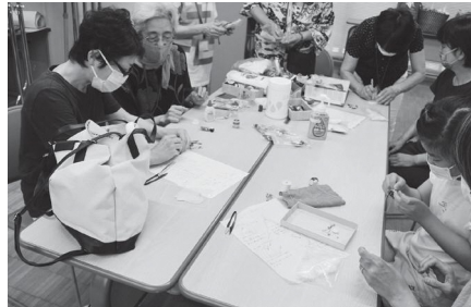
つながるフェスタin関町

また、区内8か所の図書館で町会・自治会やNPO法人、ボランティア団体など区内で活動する地域活動団体を紹介するパネル展を行いました。ご参加いただいた団体の皆様、ご来場いただいた皆様、ありがとうございました。