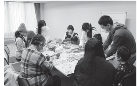
つながるフェスタin大泉