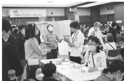
つながるフェスタin練馬