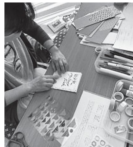
自分史ミニブックを作るワークショップの様子

っています。イベント内容は、自分たちの興味のあること、やりたいことをもとに決めており、昨年