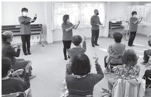
手話ソングサークルをゲストに迎え、手話を覚えたり、歌を歌ったり。楽しみながら脳を活性化

いざという時に支え合えるよう、地域で顔の見える関係を築くための茶話会を開いているのが「お茶の間ネット」です。現在は桜台地域の「澗の会」と早宮地域の「満咲くの会」を月に1回ずつ開催。コロナ禍のため、昼食やお茶などの飲食を伴うおしゃべりは中断していますが、手話ソングやフラワーアレンジメント、手品、演奏会など、毎回趣向を凝らした企画が好評を博しています。