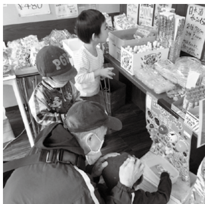
引いたくじによって仮想通貨に見立てたメダルが発行され、好きな駄菓子が買えるシステム

に特化した情報を発信している「ネリマージュ」は、無料で会員登録ができ、現在会員数は約300名。会員にはイベント情報が届き、掲示板やブログを自由に立ち上げて会員同士で情報交換することもできます。