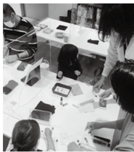
葛飾区で開催したリアルなワークショップにはたくさんの親子が参加しました

しめるんだ!と発見の連続でした。固定概念が取り払われ、『みんなと同じでなくてもいいんだ』