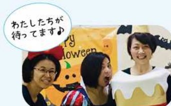
わたしたちが待っています♪