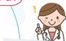
スキンシップマッサージ